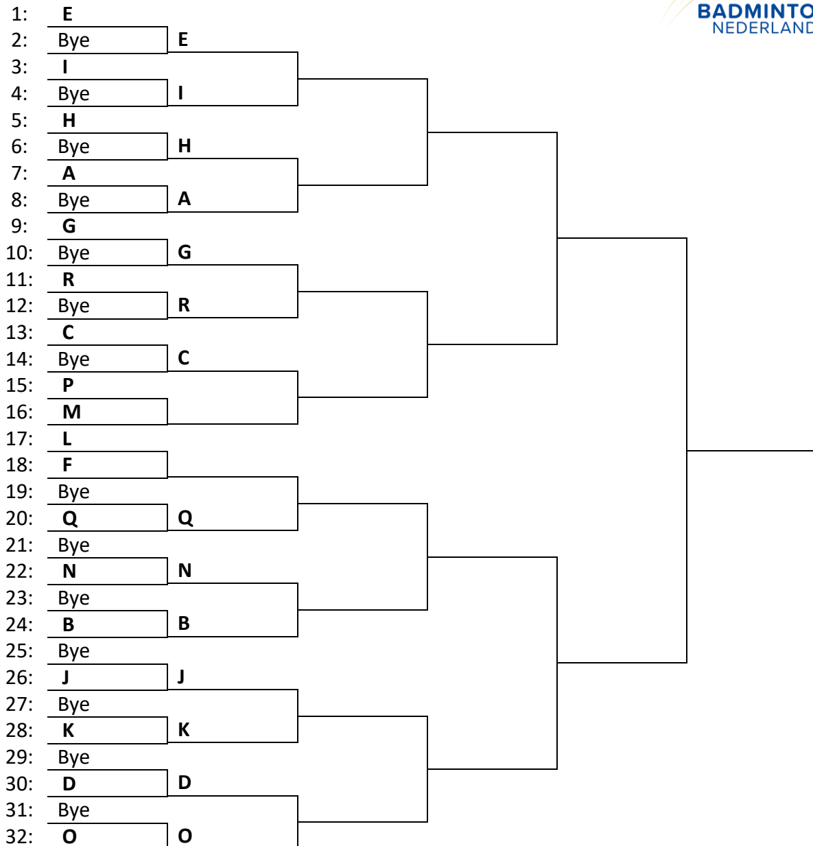
FIGUUR 6. Afvalstelsel met 18 deelnemers, waarvan 4 geplaatst

Een afvalsysteem kan ook een onderdeel van het totaal zijn, als er in voor- en eindronde gespeeld wordt. Het meest bekend is het poule/afvalsysteem. Dit betekent, dat een aantal deelnemers voorronde-wedstrijden speelt in een poule. Dat kan voor alle deelnemers het geval zijn maar er mag ook een aantal deelnemers op grond van sterkte van deze poulewedstrijden worden vrijgesteld. Deze vrijgestelden en de poulewinnaars spelen vervolgens verder in een afvalsysteem (eindronde).