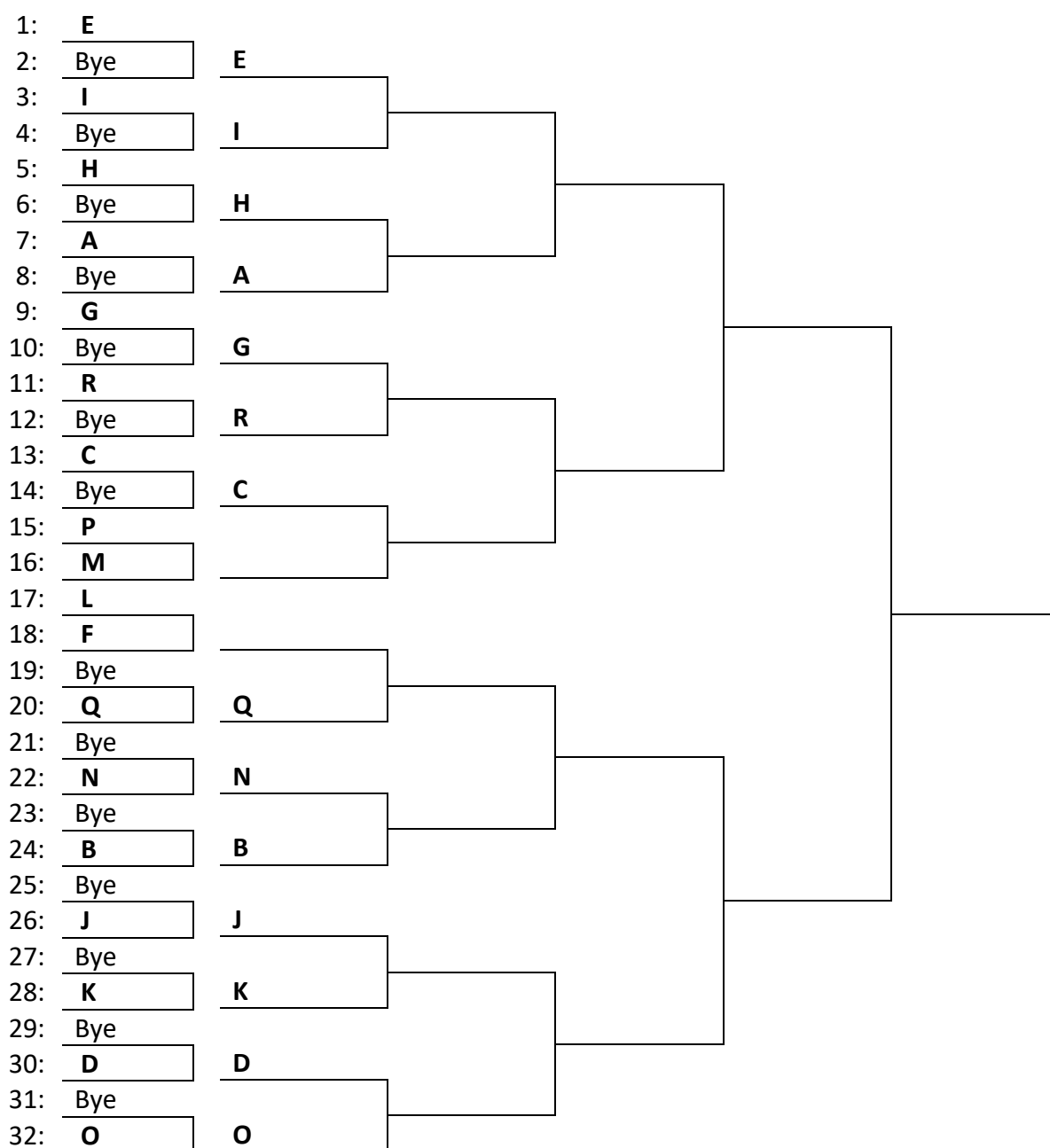
FIGUUR 6. Afvalstelsel met 18 deelnemers, waarvan 4 geplaatst

Een afvalsysteem kan ook een onderdeel van het totaal zijn, als er in voor- en eindronde gespeeld wordt. Het meest bekend is het poule/afvalsysteem. Dit betekent, dat een aantal deelnemers voorronde-wedstrijden speelt in een poule. Dat kan voor alle deelnemers het geval zijn maar er mag ook een aantal deelnemers op grond van sterkte van deze poulewedstrijden worden vrijgesteld. Deze vrijgestelden en de poulewinnaars spelen vervolgens verder in een afvalsysteem (eindronde).